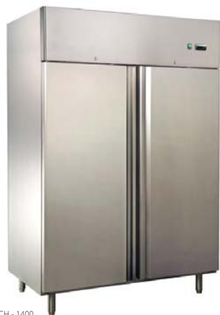
SZCH - 1400