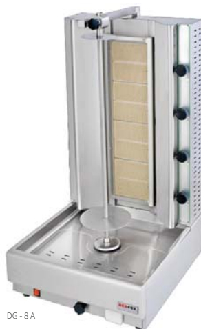
DG - 8 A