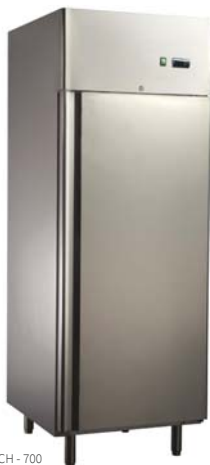
SZCH - 700