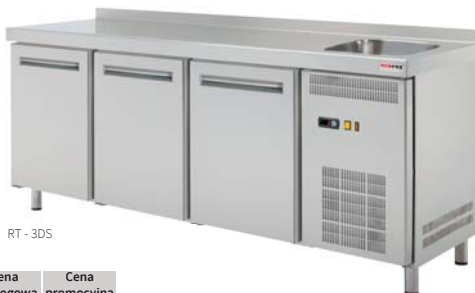
RT - 3DS