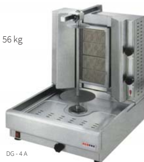
DG - 4 A