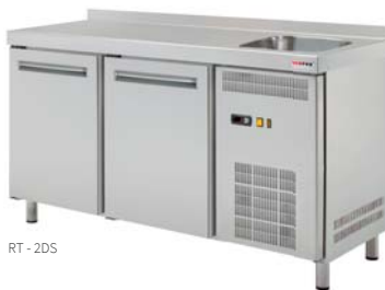
RT - 2DS